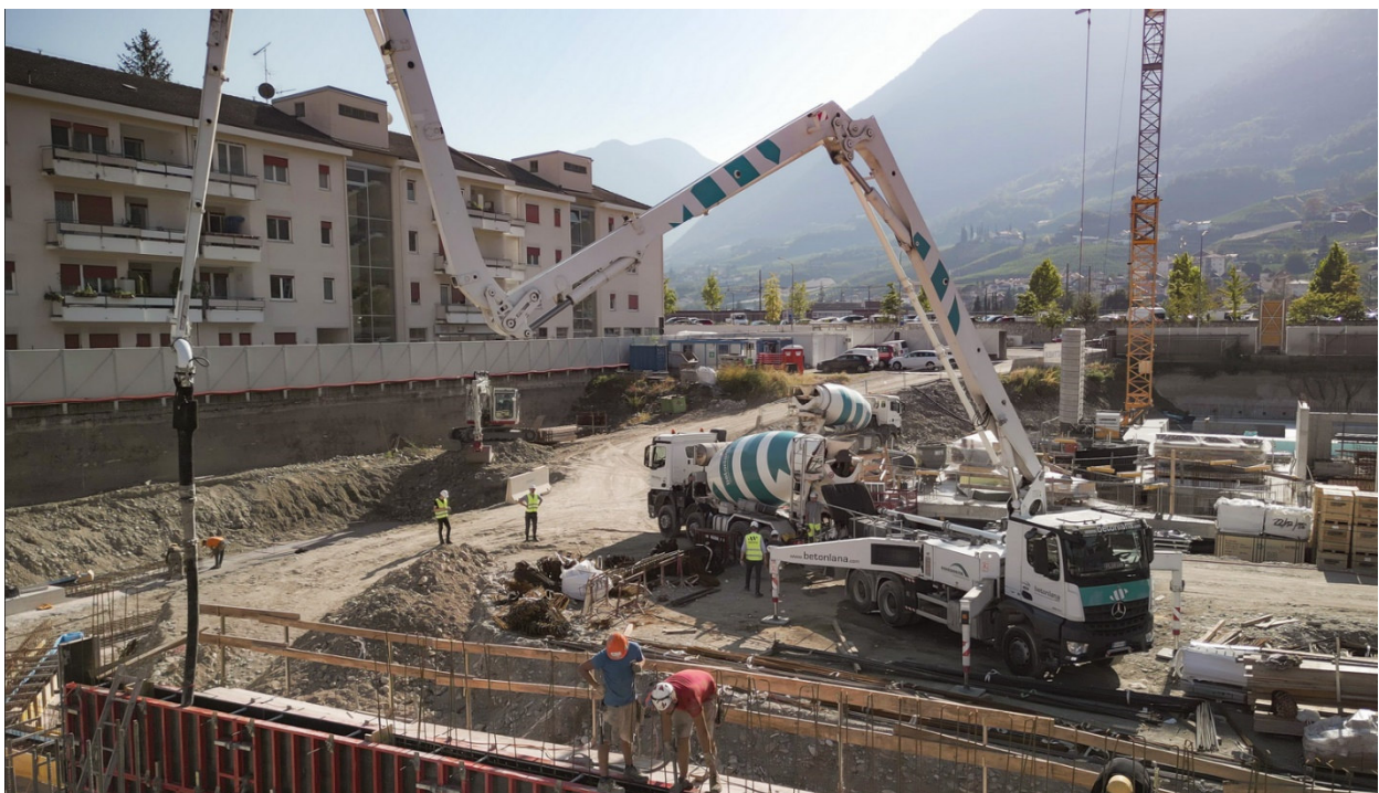
Getto del calcestruzzo con pompa

La produzione del calcestruzzo avviene all'interno di impianti di miscelazione della dimensione di 3 m 3 e il prodotto viene automaticamente scaricato nelle autobetoniere per il trasporto al cantiere. L'acqua impiegata per la produzione del calcestruzzo è parzialmente recuperata dalle operazioni di lavaggio delle autobetoniere di rientro, previa filtrazione.