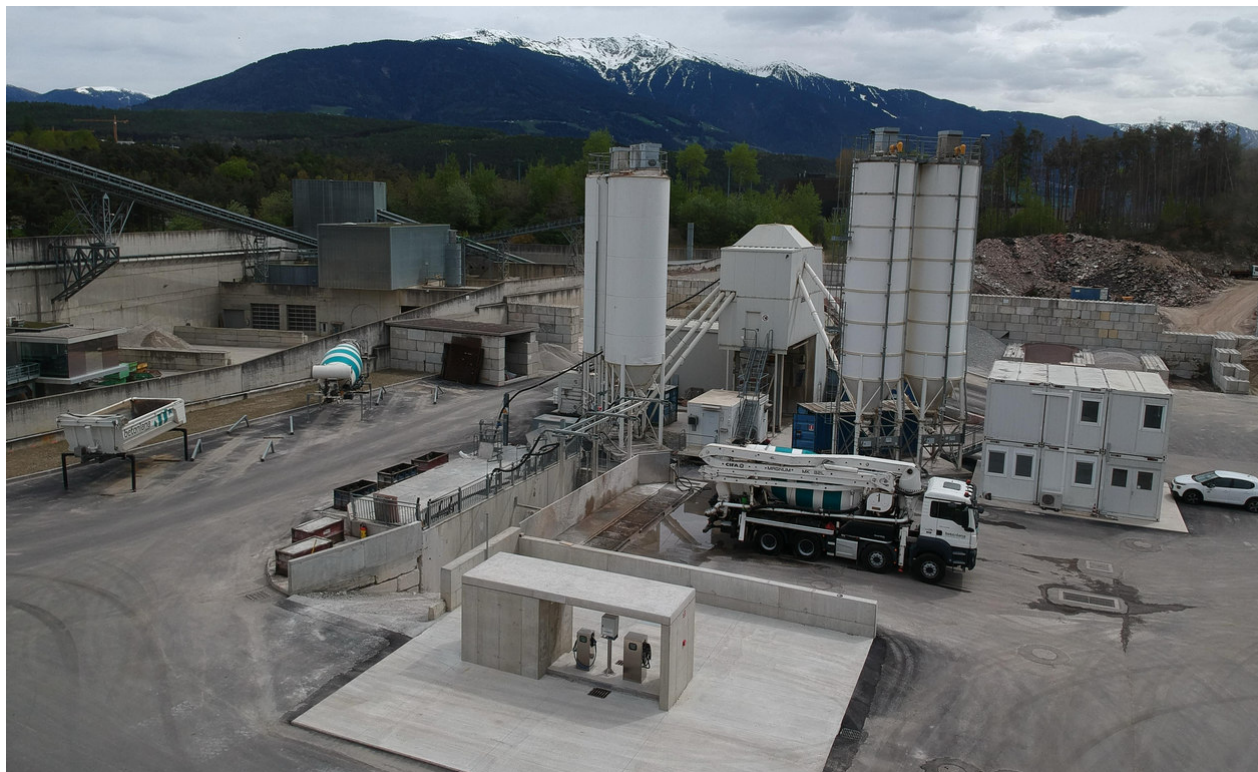
Stabilimento di Varna

betonaggio di Racines, e tre miscele contenenti anche aggregati riciclati, prodotte nell'impianto di betonaggio di Varna.