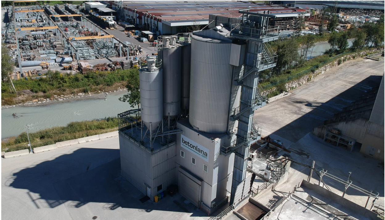
Stabilimento di Racines

Dalla fine del 2022, il settore legato alla produzione di calcestruzzo preconfezionato è stato ceduto alla ditta Beton Lana S.r.l., insieme agli stabilimenti di Racines e Varna, il parco mezzi e tutte le certificazioni ad esso collegate, mentre gli stabilimenti di produzione aggregati, di conglomerato bituminoso e il settore edile sono rimasti di proprietà di Wipptaler Bau.