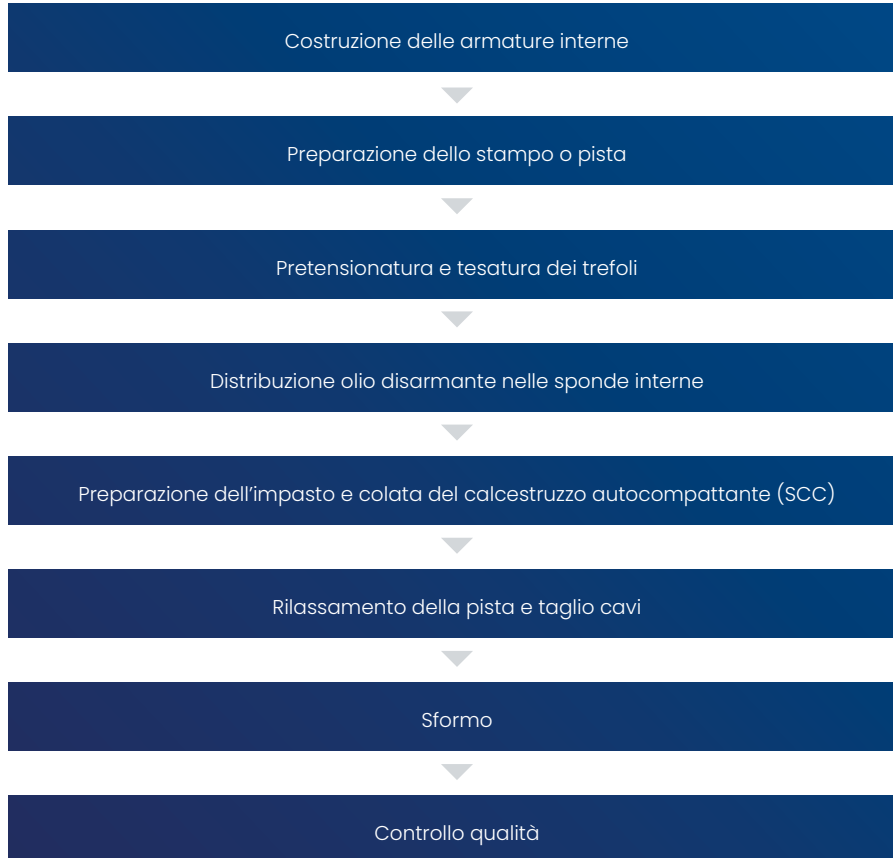
Figura 3: Schema ciclo produttivo trave prefabbricata

L'impasto confezionato, attraverso l'impianto di distribuzione aerea, viene consegnato presso lo specifico stampo di getto per la realizzazione del manufatto. Il ciclo produttivo viene ultimato al raggiungimento delle resistenze meccaniche minime necessarie ad eseguire le operazioni di rilassamento della pista e taglio cavi, delle successive operazioni di sformo e controllo qualità sul prodotto finito che anticipano l'allocazione presso lo stoccaggio interno aziendale, in attesa di procedere all'invio del manufatto presso il cantiere di posa.