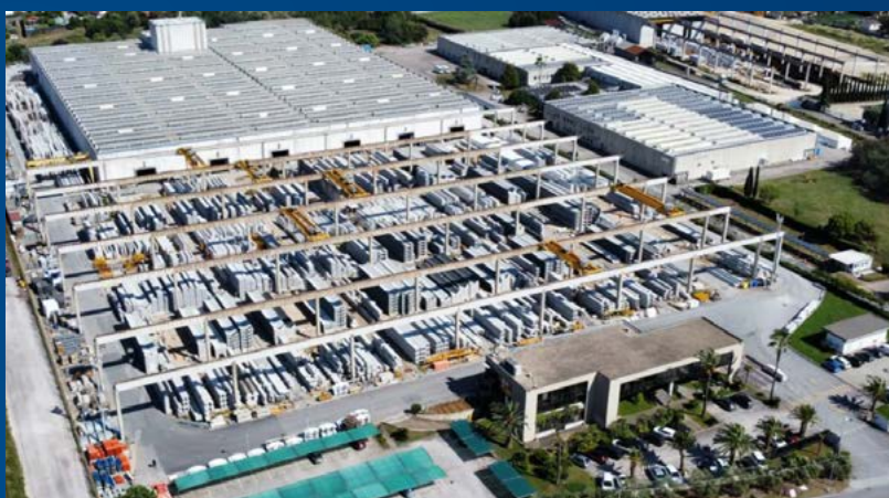
Figura 1: Stabilimento di Aprilia (LT) – UP3

Lo stabilimento di Aprilia (UP3) possiede una superficie di 102.000 mq di cui 24.000 coperti , ha una capacità produttiva di c.a. 50.000 mc/anno ed un'area di stoccaggio di 28.200 mq