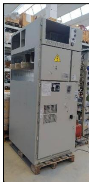
Figura 1: SCOMPARTO LINEA Enel GSCM 690/09 (GSCM 696/1)

In questo studio viene considerato il ciclo di vita del prodotto, dall'estrazione delle materie prime alla dismissione e smaltimento a fine vita, secondo l'approccio dalla culla alla tomba – “from cradle to grave”. I moduli inclusi nella valutazione, in accordo alla PCR e alla normativa tecnica di riferimento.