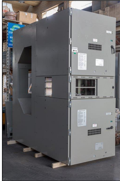
Figura 1: Scompato bipiano