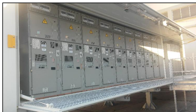
Figura 1: Enel GSCM 770

L'azienda ha deciso di realizzare lo studio LCA per il prodotto “SEZIONE MT IN CONTAINER PER CABINA PRIMARIA Enel GSCM 770 (DY770)” per poter analizzare quali siano gli impatti delle diverse fasi del prodotto e individuare possibili azioni di miglioramento per poterne migliorare le prestazioni ambientali. Si tratta di una EPD specifica del prodotto richiesto in fase di gara ENEL. In questo studio viene considerato il ciclo di vita del prodotto, dall'estrazione delle materie prime alla dismissione e smaltimento a fine vita, secondo l'approccio dalla culla alla tomba – “from cradle to grave”. I moduli inclusi nella valutazione, in accordo alla PCR e alla normativa tecnica di riferimento.