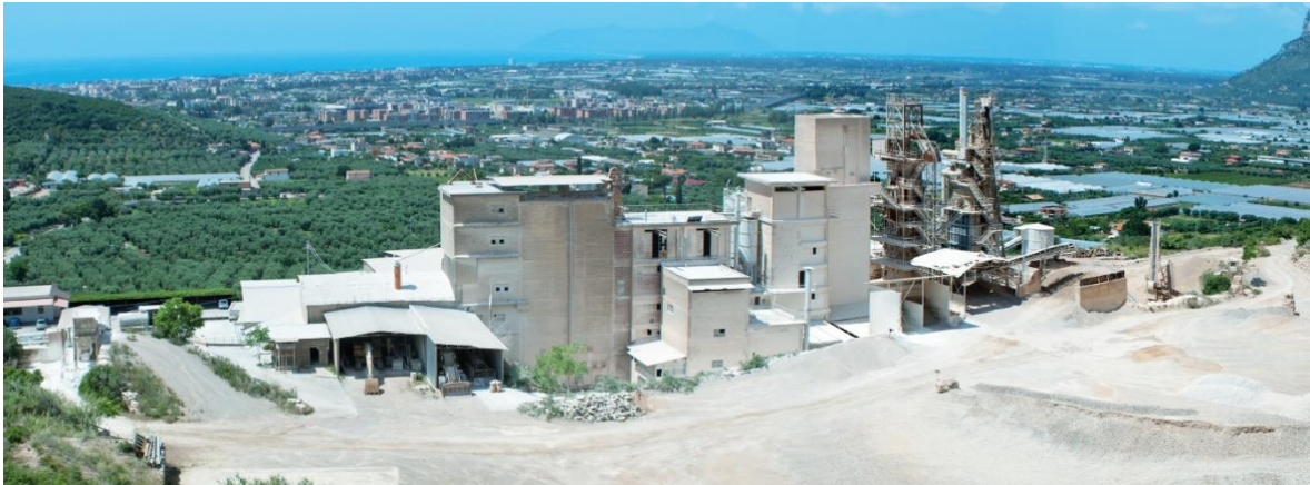
Figura 1 – Impianto produttivo di Italcacce S.r.l., sito a Terracina.

Italcacce è dotata di impianti altamente tecnologici gestiti da sistemi informatici integrati, altoforni di ultima generazione e la produzione è scrupolosamente controllata da un innovativo laboratorio di analisi chimico-fisiche. I sistemi di produzione puntano costantemente al più elevato livello qualitativo.