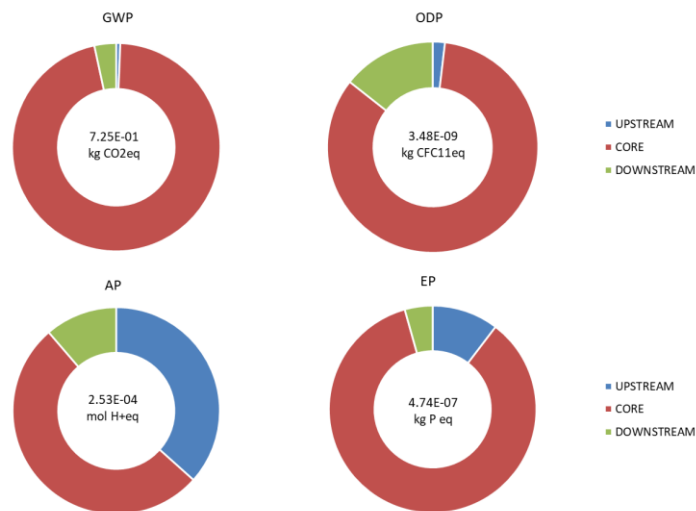
Figura 3 – Grafico di sintesi di quattro dei principali indicatori di impatto (GWP- total, ODP, AP ed EP) con i contributi di ogni fase del processo (upstream, core e downstream).

Per la maggior parte delle categorie di impatto (e.g. GWP-total, ODP, AP, EP) incidono principalmente le emissioni ed i consumi relativi alla cottura del carbonato di calcio della fase di Core.