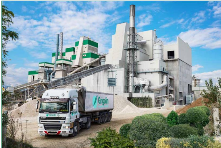
Figura 1- Impianto produttivo di Fornaci Calce Grigolin S.p.a., sito a Ponte della Priula (TV).

La gamma di prodotti offerta per l'edilizia è ampia e specializzata, inoltre la continua innovazione nella calce con varie specialità, consente di servire importanti aziende in vari settori produttivi.