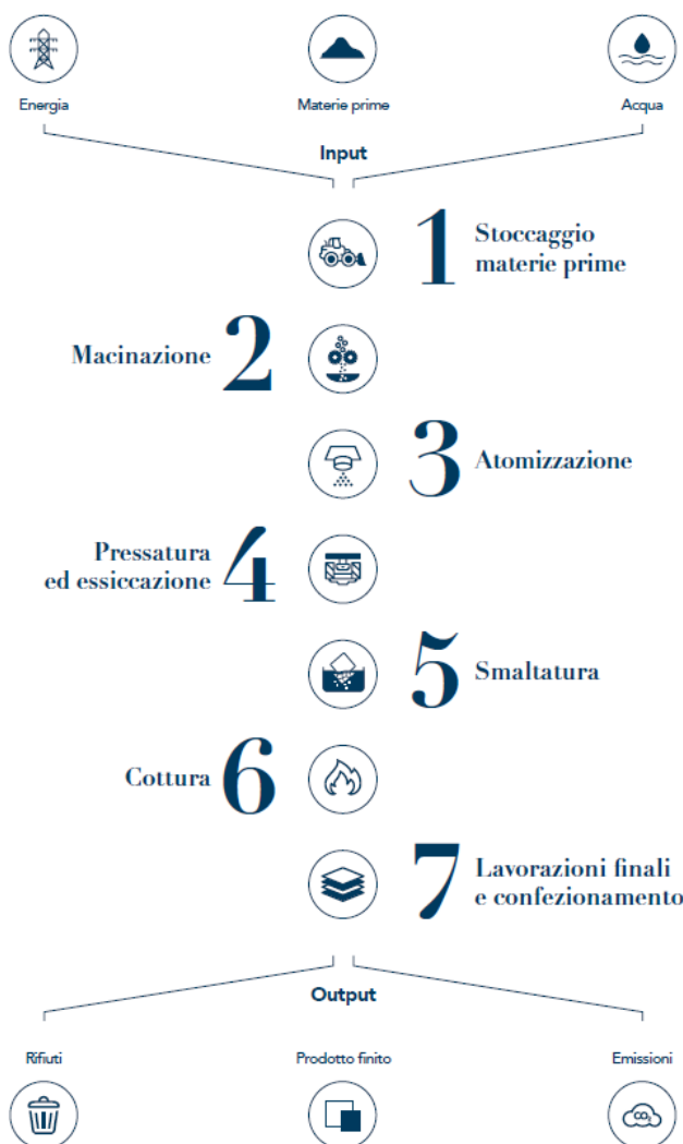
schema processo produttivo

I pallet su cui sono state posizionate le scatole di prodotto finito vengono stoccati in un apposito parcheggio situato all'esterno dello stabilimento. Il prodotto è quindi pronto per essere spedito, tramite al cliente. Presso lo stabilimento è stato installato un sistema informatico a radiofrequenze per la gestione della movimentazione del prodotto finito a magazzino (attraverso una nuova etichetta con codice a barre per identificazione pallet). Questo intervento permette un maggior controllo del magazzino prodotto finito e di ridurre al minimo gli errori di spedizione.