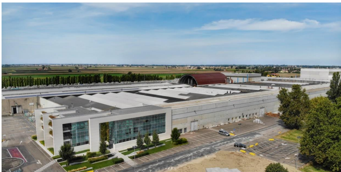
Stabilimento Panariagroup di Finale Emilia