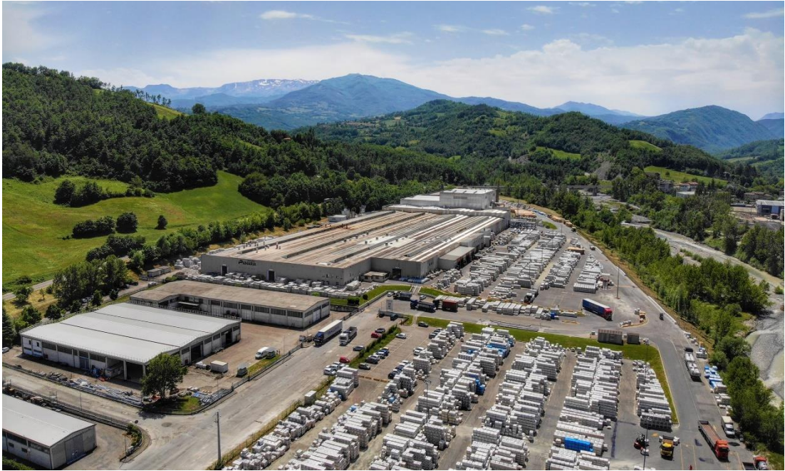
Stabilimento Panariagroup di Toano, località Fora di Cavola