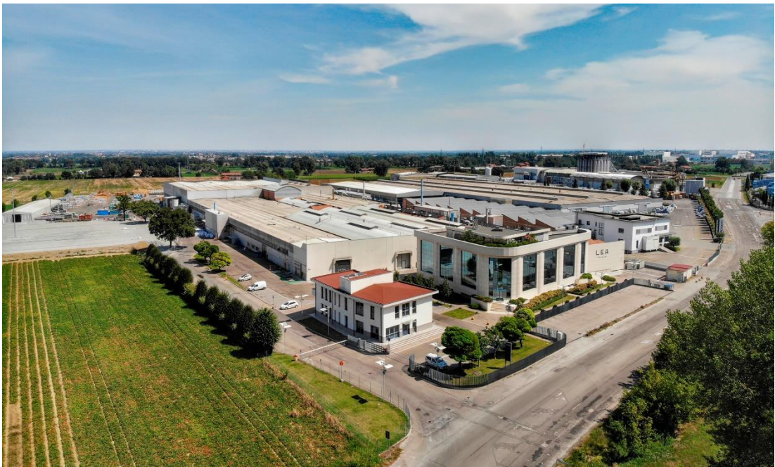
Stabilimento Panariagroup di Fiorano Modenese