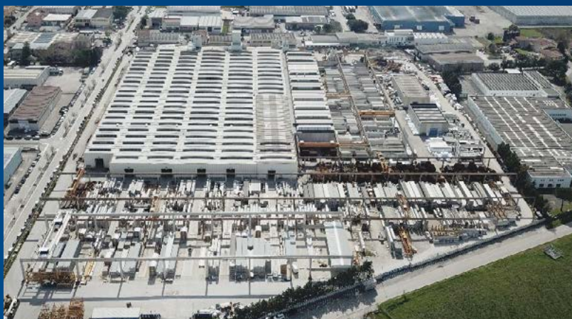
Figura 1: Stabilimento di Bastia Umbra (PG) – UPI

Lo stabilimento di Bastia Umbra (UPI) possiede una superficie di 85.000 mq di cui 30.500 coperti , ha una capacità produttiva di c.a. 60.000 mc/anno ed un'area di stoccaggio di 24.000 mq .