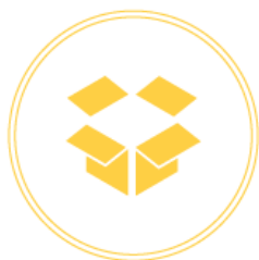
DIVISIONE INDUSTRIA ED IMBALLAGGIO